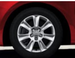
De série sur Attraction : Jantes en aluminium coulé style 7 branches, 6,5 J x 15", avec pneus 205/55 R15 Code C2V