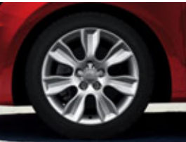
De série sur Ambition : Jantes en aluminium coulé style 7 branches dynamiques, 7 J x 16", avec pneus 215/45 R16 Code CQ3