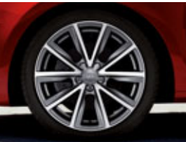
De série sur Ambition Luxe, en option sur Attraction et Ambition : Jantes en aluminium coulé style 5 branches V, anthracite, partiellement polies, 7,5 x 17", avec pneus 215/40 Code CP3