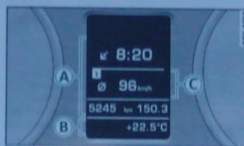
Abb. 11 Fahrerinformationssystem im Kombiinstrument

Gilt für Fahrzeuge mit Fahrerinformationssystem ohne Multifunktionslenkrad