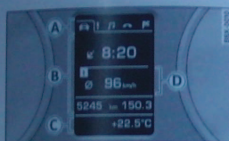
Abb. 14 Fahrerinformationssystem-Kombinatrainer