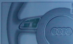
Abb. 15 Multifunktionslenkrad. Bedienelemente des Bordcomputers

Die Bedienung des Fahrerinformationssystems erfolgt über das Multifunktionslenkrad ⇒ Abb. 15.