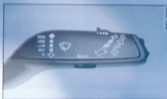
Abb. 12 Scheibenwischerhebel: Bedienelemente des Bordcomputers

Die Bedienung des Fahrerinformationssystems erfolgt über die Bedienelemente im Scheibenwischerhebel ⇒ Abb. 12.