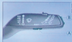
Abb. 13 Scheibenwischerhebel: Bedienelemente des Bordcomputers

Der Bordcomputer wird mit zwei Schaltern im Scheibenwischerhebel bedient.